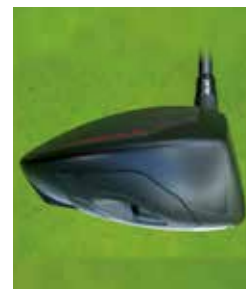
↑インパクト時のロフトの変化を抑え、風に負けない強い弾道を生むディープバック設計。