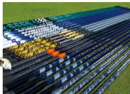
↑TR-Xドライバーに用意される豊富なカスタムシャフト。写真は一部で、さらに多くのシャフトからチョイス可能。

↑船越さんにピッタリの組み合わせは、TM-X 10.5度にペンタスターTRブルー6S、スリーブポジションはフラット。