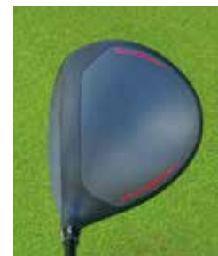
↑高打ち出し低スピンを生むカーボンコンポジット構造と上級者好みの洋ナシ型のヘッド形状。