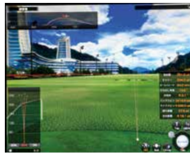
↑計測器で弾道を確認しながら、マイドドライバー、TM-X(標準シャフト)、TM-X(カスタムシャフト)を試打。

プロ・上級者好みの洋ナシ型のヘッド形状、ややフラットなライ角56・5度、ストレートなフェース向き、450cm 3 のヘッドサイズ、そして、つかまり過ぎを嫌うゴルファーに最適な重心設計を施し、強振してもつかまり過ぎない安心感が得られる最新ドライバーに仕上げられている。