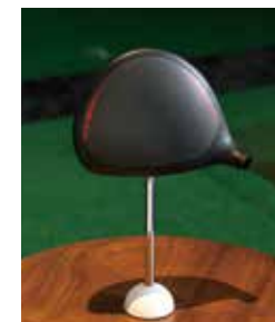
↑操作性と高慣性モーメントを両立し、さらに、つかまり過ぎを抑える重心設計。